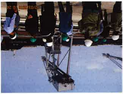
เยี่ยมชม