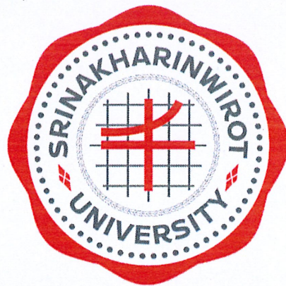
ตรา เครื่องหมาย หรือสัญลักษณ์ ประจำมหาวิทยาลัย แบบภาษาอังกฤษ

มาตรฐานสีของตรา เครื่องหมาย หรือสัญลักษณ์ ประจำมหาวิทยาลัย